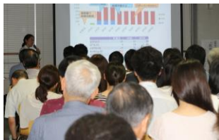
次回は東京衛生病院で開催予定