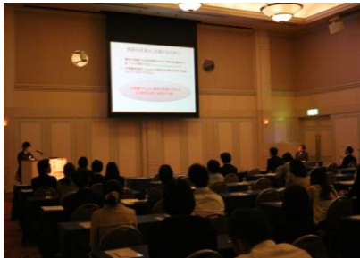
9/12開催 荻窪消化器カンファレンスの様子