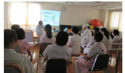
↑武蔵野療園病院様のラウンド後の 研修の様子