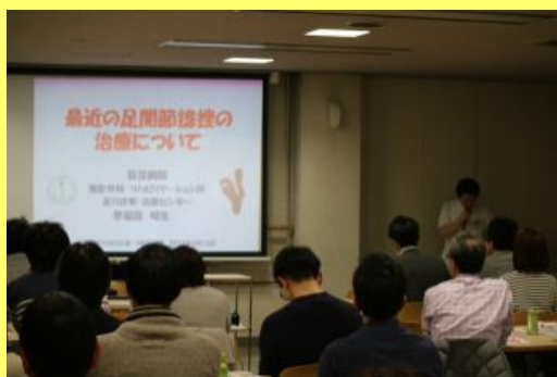
おぎくぼりハビリの会の様子 (2017年3月13日開催)

当院は整形外科疾患が手術の約4割を占め、カテーテル治療も年間1,000件を超える件数を行っております。これらの疾患からの早期回復と社会復帰を促進するためにも早期のリハビリテーションの介入が必要です。